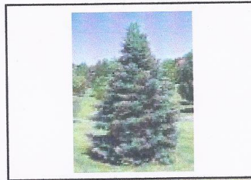
Les oiseaux dans les arbres : pigeon, merle, étourneau, pinçon, poule d'eau, pie, corneil, troglodit mignon... Feuillus, conifères : figuier, cèdre, sapin, cerisier, cyprès...