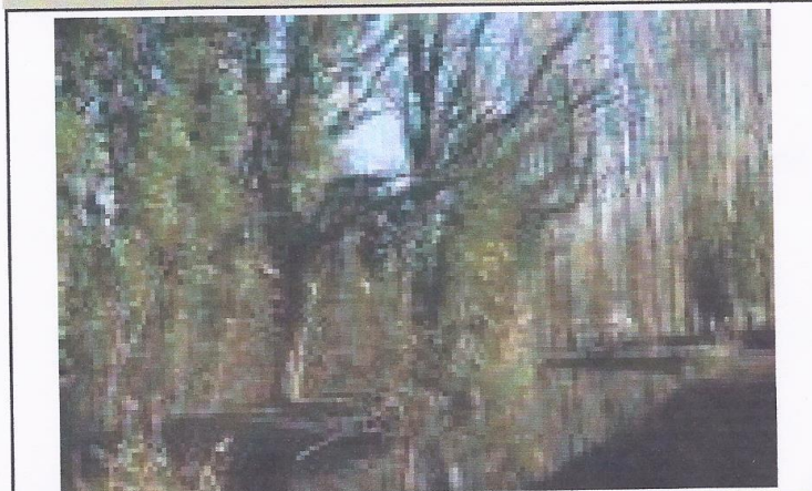
Dans le parc de la Mairie, des poules d'eau, des pics verts et encore bien d'autres oiseaux ...