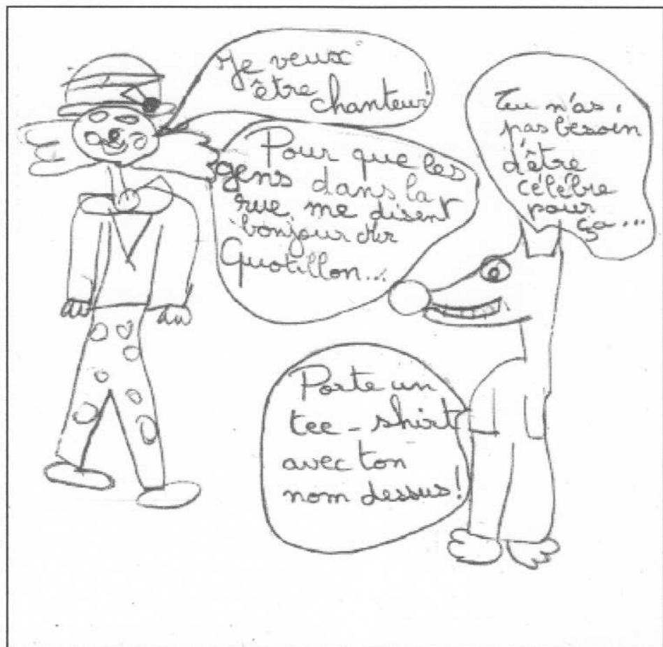
Devenir chanteur ...

Début novembre les élèves du cycle 3 ont chanté avec un Quatuor à Cordes à l'Espace Olympes de Gougues. Ce fut une grande réussite pour tous ! Encore bravo !