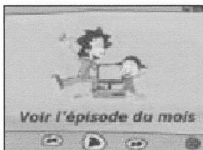
Vinz et Lou et internet ou comment être de bons internautes ?