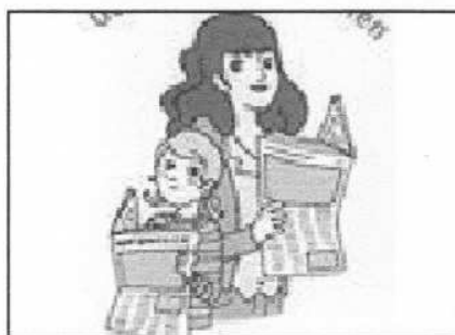
Chaque jour un élève présente un article du journal

La maîtresse nous aide si on n'arrive pas trop à expliquer notre article. Après la présentation, nos camarades nous posent des questions. Alors on montre où ça s'est passé sur la carte du monde et on dit quand ça s'est passé. Vraiment on apprend beaucoup de choses !