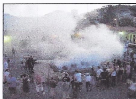
Le raku c'est aussi beaucoup de fumée.