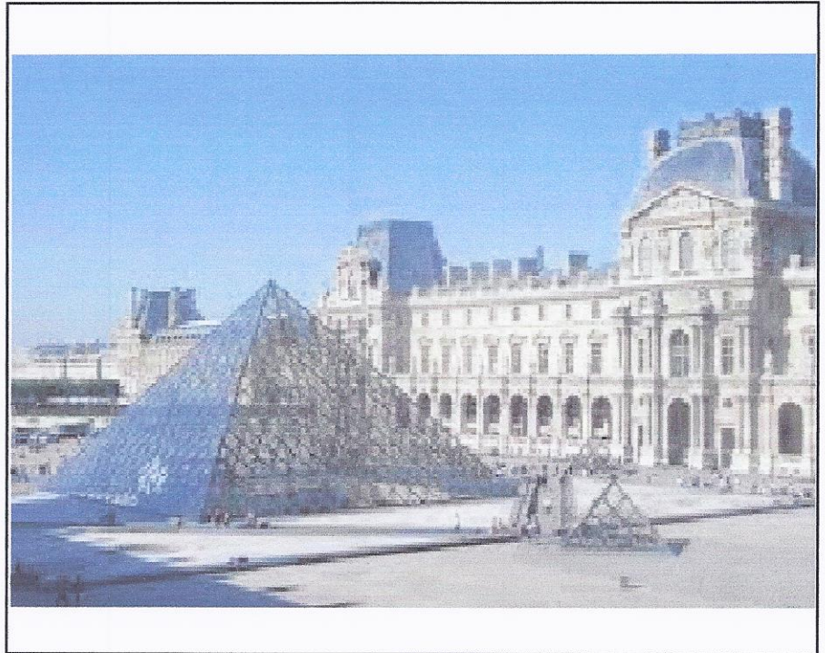
La Pyramide du Louvre un jour de juin 2012...