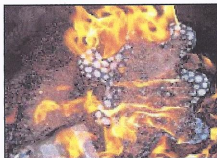
Le raku, technique de cuisson des potiers ...

Voilà, encore de très beaux souvenirs pour tous que la préparation et l'inauguration de cette fresque !