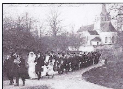
Une noce en 1900 et son cortège.

La fête de l'école a eu lieu comme chaque année sous le soleil, la joie et la bonne humeur des petits comme des grands.